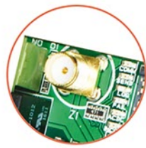
Złącze antenowe SMA