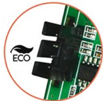
Współpraca z dedykowanym zasilaczem PSR-ECO 2012