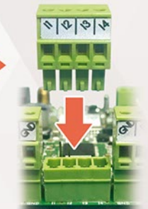
Rozłączne listwy zaciskowe