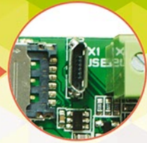
Do programowania port USB micro B