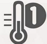
Wejście na czujnik temperatury