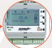
Obsługa wyświetlacza LCD